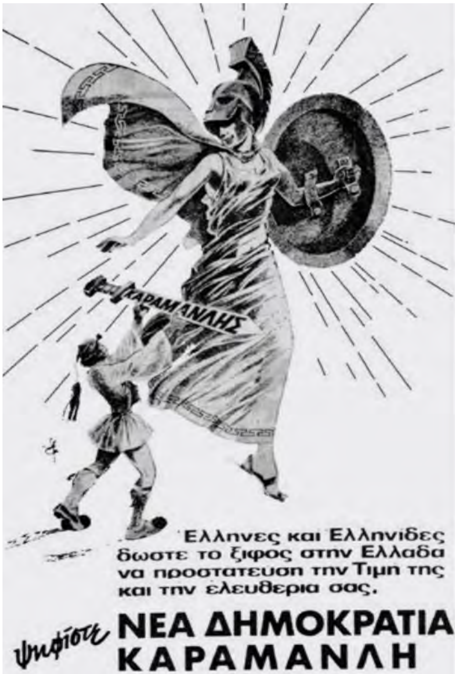
Η πρώτη αφίσα στην ιστορία της Νέας Δημοκρατίας που κυκλοφόρησε για τις εκλογές του 1974. Η Ελλάδα με αρχαιοελληνική πολεμική εμφάνιση, δέχεται το ξίφος που γράφει επάνω «Καραμανλής» που της το προσφέρει ένας τσολιάς. Άλλες εποχές κι σίγουρα άλλες προσεγγίσεις...

Η δεκαετία του '80 ανήκε στο ΠΑΣΟΚ και η Νέα Δημοκρατία την πέρασε όλη ως το κόμμα της αξιωματικής αντι-