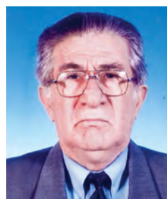
Γράφει ο Παναγιώτης Παπαδόπουλος Φιλολόγος