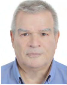
Του Χρήστου Μπλασιώτη

-Μια... σκυταλοδρομία «γαλάζιων» στελεχών από το 1974 μέχρι σήμερα