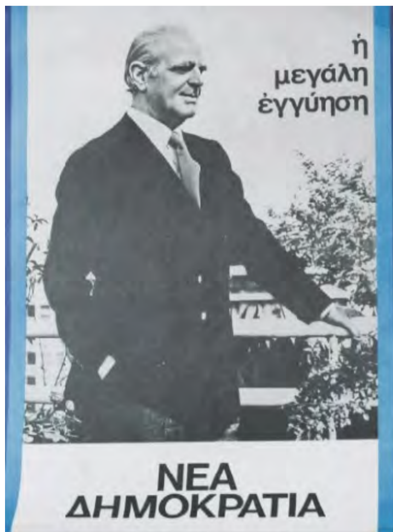
Ο «πυρσός» καθιερώθηκε ως έμβλημα της Νέας Δημοκρατίας το 1985. Μέχρι τότε το πρόσωπο του Κωνσταντίνου Καραμανλή ήταν το σύμβολο για το κόμμα της Νέας Δημοκρατίας. Ενδεικτικές είναι και δύο αφίσες από τις εθνικές εκλογές του 1977.