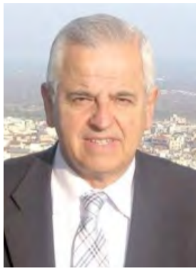
Γράφει ο Αναστάσιος Βασιιάδης

Η ανοιξιάτικη εποχή που βρίσκεται σε εξέλιξη, σηματοδοτεί την προετοιμασία του τόπου για την θερινή τουριστική περίοδο, κατά την οποία αναμένονται οι αφίξεις των επισκεπτών στις διάφορες περιοχές της χώρας για διακοπές. Στις τουριστικού ενδιαφέροντος περιοχές που προσδοκούν πολλά από τον τουρισμό, οι προετοιμασίες, αρχίζουν να μεθοδεύονται με στόχο να παρουσιαστεί η όσο το δυνατόν καλύτερη δυνατή εικόνα προς τους ξένους αλλά και τους Έλληνες τουρίστες.