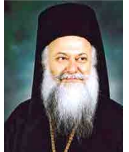
της Κίτρους, Κατερίνης και Πλαταμώνος κ. Γεώργιος.

Το Σάββατο 3 Νοεμβρίου το πρωί θα λάβει μέρος στην Πολυαρχιερατική Θεία Λειτουργία στον Ιερό Ναό Αγίου Γεωργίου Περιστάσεως Κατερίνης επί τη εορτή της Ανακομιδής των Ιερών Λειψάνων του Αγίου Γεωργίου κατά την οποία άγει τα ονομαστήρια του ο Σεβ. Μητροπολί-