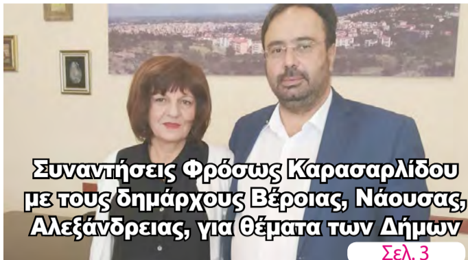
Συναντήσεις Φρόωςης Καρασαρλίδου με τους δημάρχους Βέροιας, Νάουσας, Αλεξάνδρειας, για θέματα των Δήμων