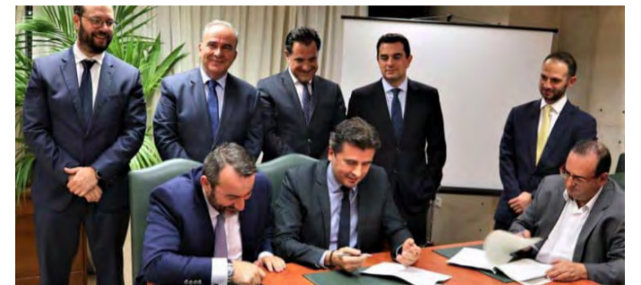
Συνάντηση τευτλοπαραγωγών σήμερα με τον πρόεδρο της Royal Sugar

ΑΔΕΣΜΕΥΤΗ ΚΑΘΗΜΕΡΙΝΗ ΕΦΗΜΕΡΙΔΑ ΤΟΥ ΝΟΜΟΥ ΗΜΑΘΙΑΣ