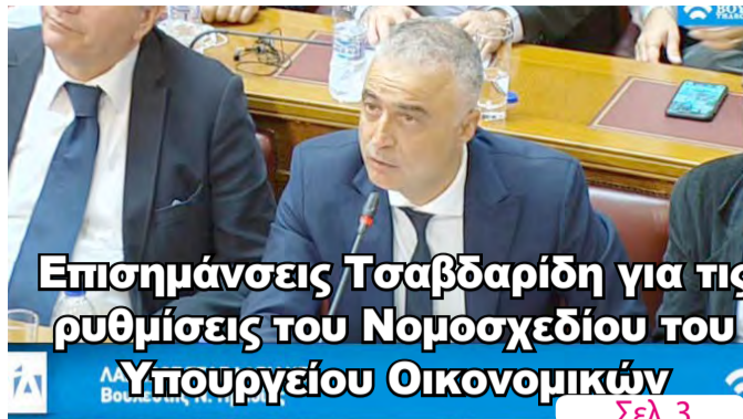
Επισημάνσεις Τσαβδαρίδη για τις ρυθμίσεις του Νομοσχεδίου του Υπουργείου Οικονομικών