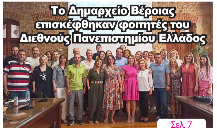
Το Δημαρχείο Βέροιας επισκέφθηκαν φοιτητές του Διεθνούς Πανεπιστημίου Ελλάδος Σελ. 7