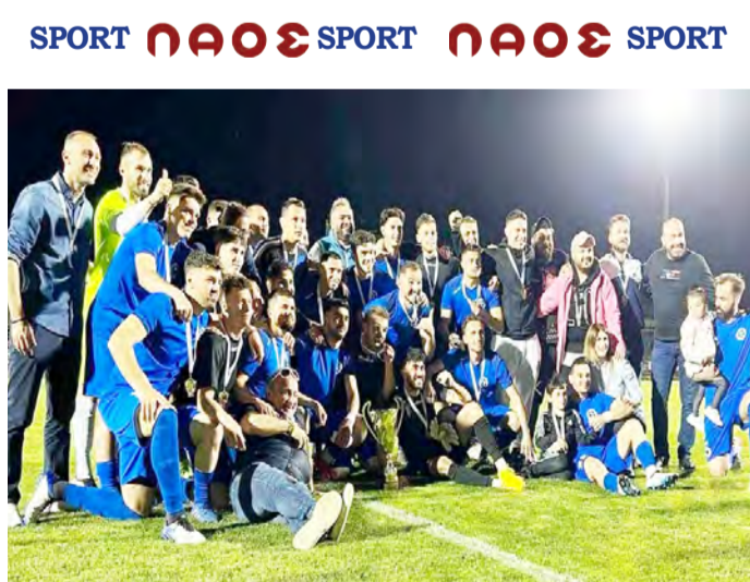
Έγραψε ιστορία. Ο Αστéρας Τριποτάμου πέρασε με 1-4 στην Επανομή επί της Αναγέννησης Μία πορεία αξιοζήλευτη για μία νέα ομάδα του Δήμου Βέροιας Σελ. 8