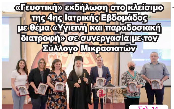
«Γευστική» εκδήλωση στο κλείσιμο της 4ης Ιατρικής Εβδομάδος με θέμα «Υγιεινή και παραδοσιακή διατροφή» σε συνεργασία με τον Σύλλογο Μικρασιατών Σελ. 16