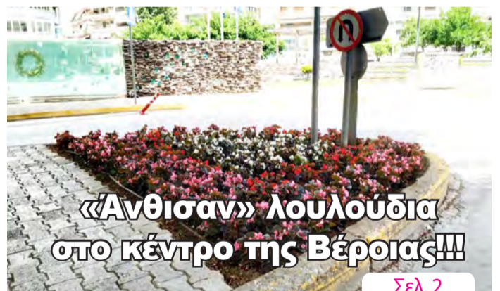
«Άνθισαν» λουλούδια στο κέντρο της Βέροιας!!! Σελ. 2