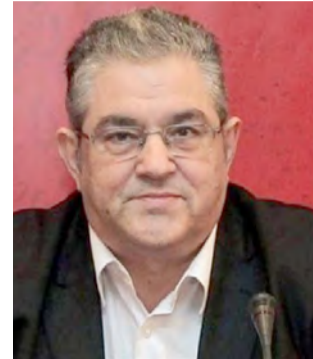
Περιοδεία του Δ. Κουτσούμπα, την Πέμπτη στην Ημαθία -Κεντρική ομιλία στην Πλατεία Δημαρχείου της Βέροιας Σελ. 7

ΑΔΕΣΜΕΥΤΗ ΚΑΘΗΜΕΡΙΝΗ ΕΦΗΜΕΡΙΔΑ ΤΟΥ ΝΟΜΟΥ ΗΜΑΘΙΑΣ