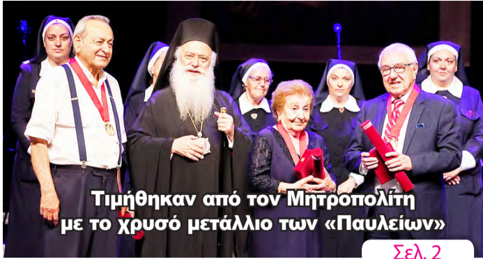
Τιμήθηκαν από τον Μητροπολίτη με το χρυσό μετάλλιο των «Παυλείων» Σελ. 2