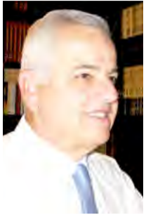
Γράφει ο ΑΝΑΣΤΑΣΙΟΣ ΒΑΣΙΛΙΑΔΗΣ